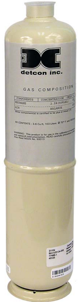
"103 Litros" 13 3/4" T x 3 1/8" D 3 lbs.

Note: Para Gases especiales favor de contactar el Departamento de ventas de Detcon.